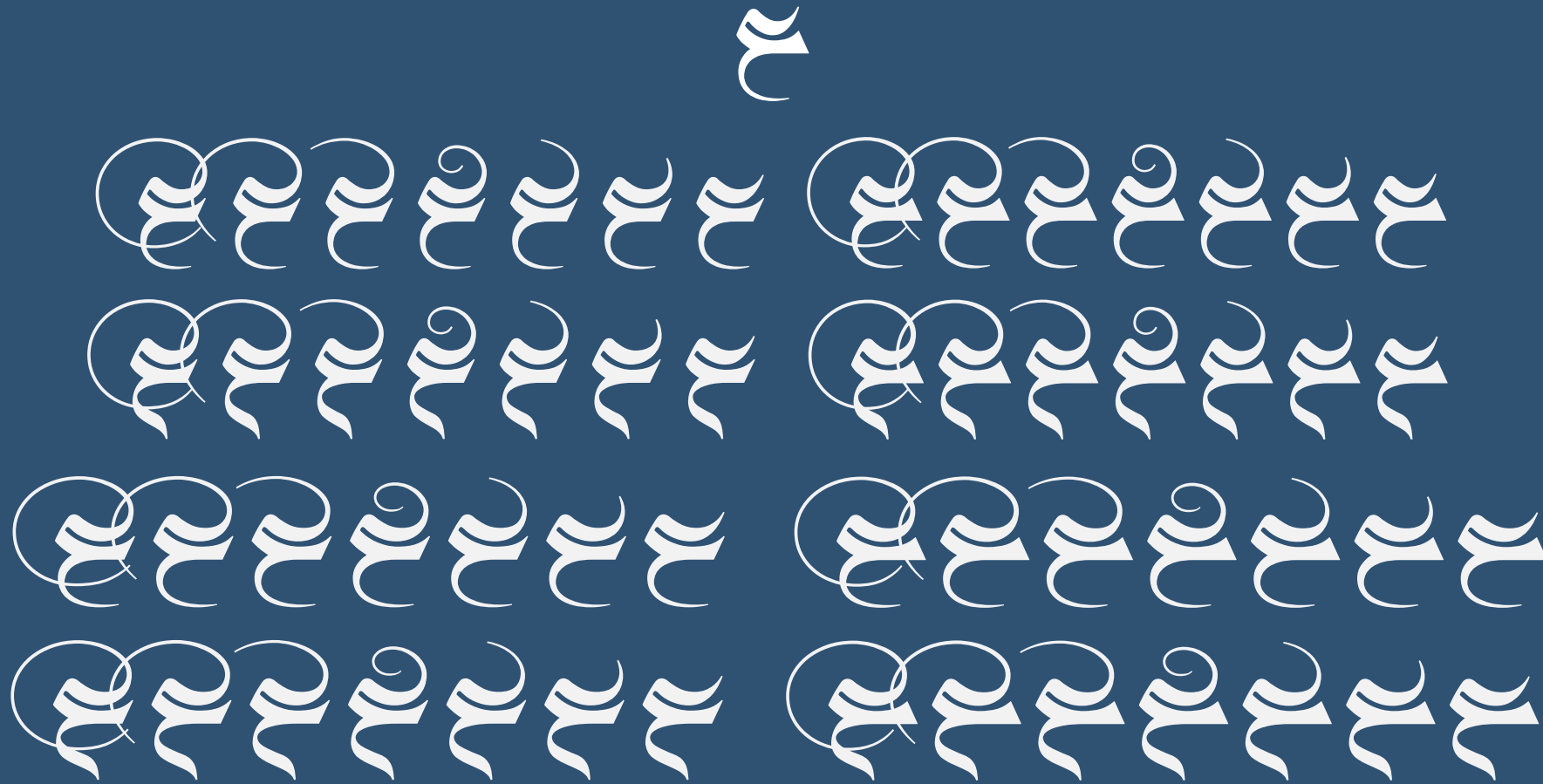
56 variants of the letter Ayn isolated