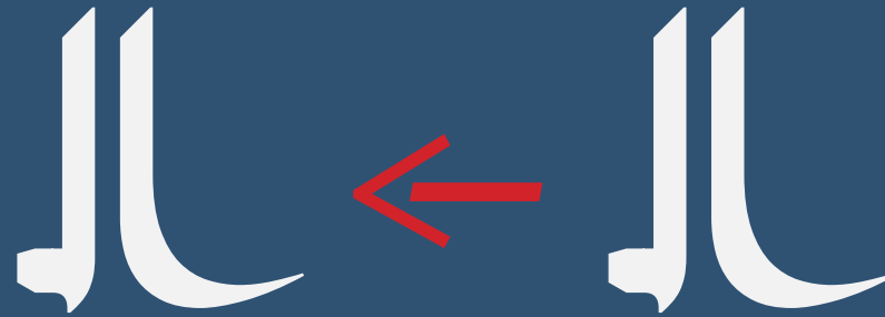
Stylistic Set #3