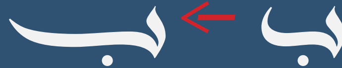
Stylistic Set #2