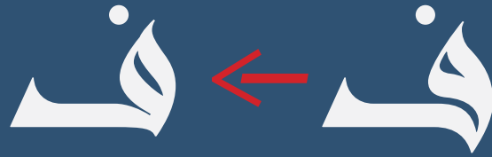
Stylistic Set #18