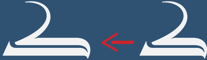
Stylistic Set #13