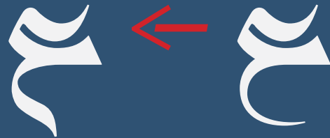
Stylistic Set #19