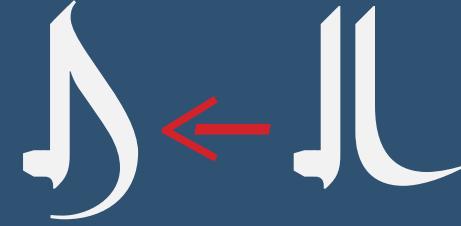
Stylistic Set #1