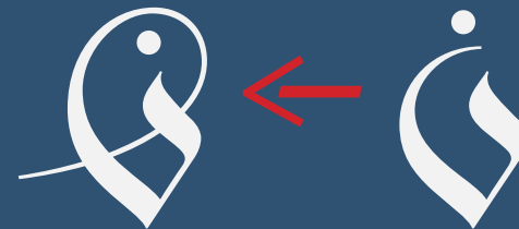
Stylistic Sets #3 - #12